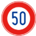
최대 속도 (50km)