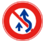
추월을 위해 도로의 오른쪽 부분을 지나갈 수 없음