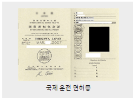
국제 운전 면허증

귀하의 국제 면허증이 D-Box에 도장이 찍혀 있는지 다시 확인하십시오. 이것으로 WC 클래스 차량 및 마이크로 버스와 같은 대형 차량을 대여받을 수 있습니다.