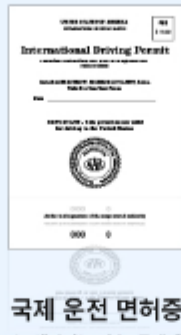
국제 운전 면허증