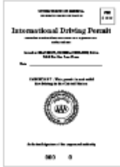
국제 운전 면허증

재류 카드는 입국 날짜에 대한 정보를 정확하게 확인할 수 없으므로, 여권으로 입국 날짜를 확인하고 있습니다.