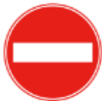
모든 차량에 폐쇄됨