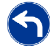
지정된 방향만 허용