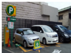
주차 구역 이미지