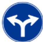
僅限指定方向行駛