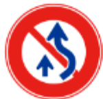
禁止跨越右車線的槽車